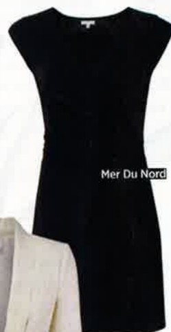
Mer Du Nord