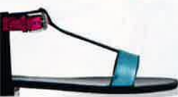
Saint Laurent Paris